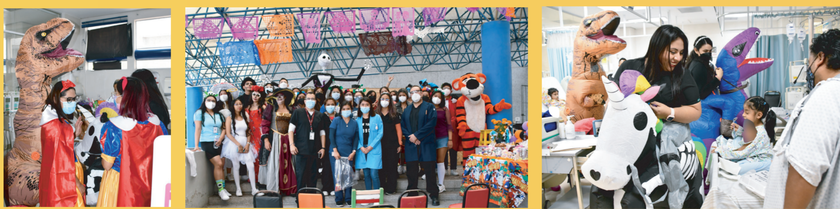
Protección de datos personales (imágenes de menores de edad) conforme a la Ley General de Protección de Datos Personales en Posesión de los sujetos obligados

Pedir calaveritas, festejar el día del niño o celebrar las posadas en el INER hacen sentir bien a todos los niños que están atravesando por una enfermedad y que se encuentran vulnerables al no poder jugar en sus casas o no poder ir a la escuela por los tratamientos médicos. El Aula Sigamos Aprendiendo en el Hospital se llena de satisfacción motivando de esta manera a los pacientes más pequeños para sacarlos adelante, que no solo mejoran clínicamente sino que también aprenden y se llevan una sonrisa de cada uno de los médicos y administrativos que colaboran en el INER para su bienestar integral.