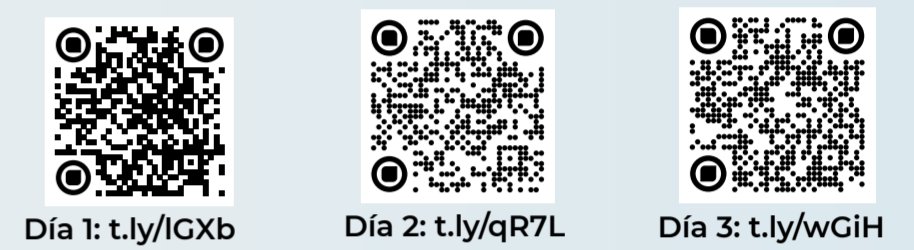
Día 1: t.ly/IGXb Día 2: t.ly/qR7L Día 3: t.ly/wGIH

Señalando el camino: liderazgo en la seguridad del paciente; Gestión del talento humano para el logro de la calidad y la Evolución del modelo de seguridad del paciente del Consejo de Salubridad General. Puedes acceder a este congreso en Canal INER: