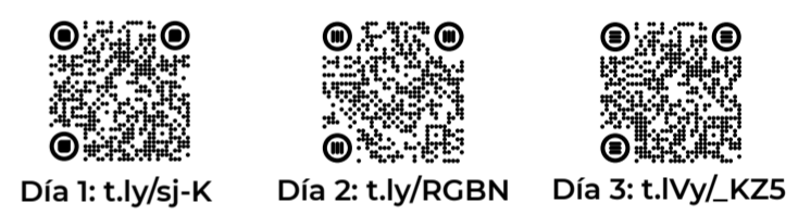
Día 1: t.ly/sj-K Día 2: t.ly/RGBN Día 3: t.ly/_KZ5

Puedes acceder a los temas impartidos en este curso a través del Canal INER