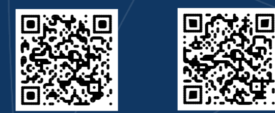
Día 1: t.ly/eHnc Día 2: t.ly/RIV2

PROGRAMA COMPLETO de las XXXIX Jornadas de Enfermería, INER 2022: https://t.ly/pBzt