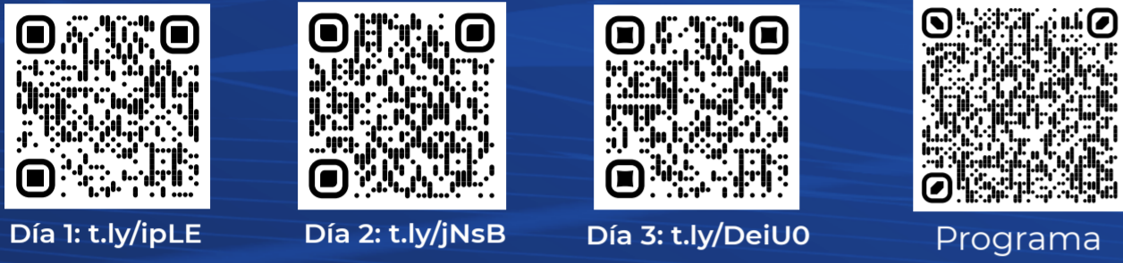
Día 1: t.ly/ipLE Día 2: t.ly/jNsB Día 3: t.ly/DeiUO Programa

Consulta estos 3 días de las Jornadas en el Canal INER: http://t.ly/ipLE Así como el Programa completo: t.ly/dzll